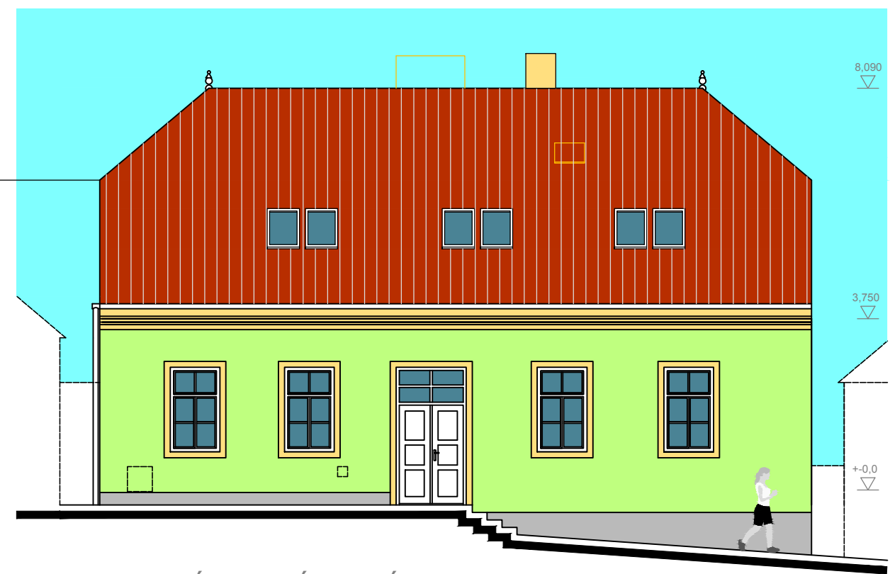
POHLED Z NÁVSI (ZÁPADNÍ)